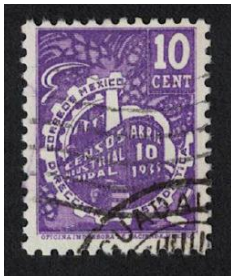
(1935) Spis przemysłowy

Przykładem państwa emitującego wiele znaczków poświęconych spisom branżowym jest Meksyk . Jest to państwo numer 4 w chronologicznym ujęciu znaczków o tematyce spisowej (za Japonią, Egipcem i Rumunią).