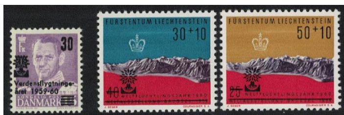
Dania i Liechtenstein

Prowizoria – znaki pocztowe wykonane i stosowane z podjętym z góry zamiarem tymczasowości użytkowania do czasu zastąpienia ich znakami definitywnymi. Drugim typem prowizoriów są okolicznościowe wydania nadrukowe (bez zamiaru zastąpienia ich wydaniem definitywnymi), gdy brak na to czasu albo pocztę należy na użytkowaniu posiadanych zapasów. Ten drugi typ występuje w poniższych przypadkach.