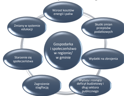
Wykres 3. Wybrane uwarunkowania krajowe w długim okresie