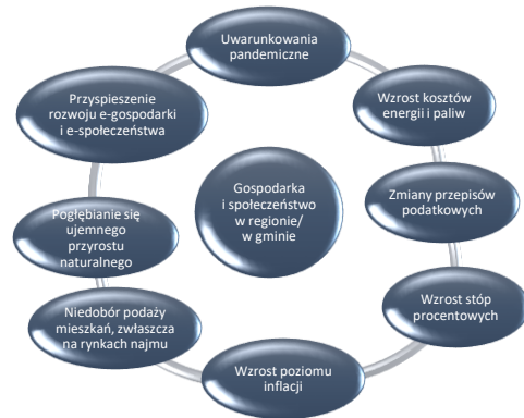
Wykres 1. Wybrane uwarunkowania krajowe w krótkim i średnim okresie