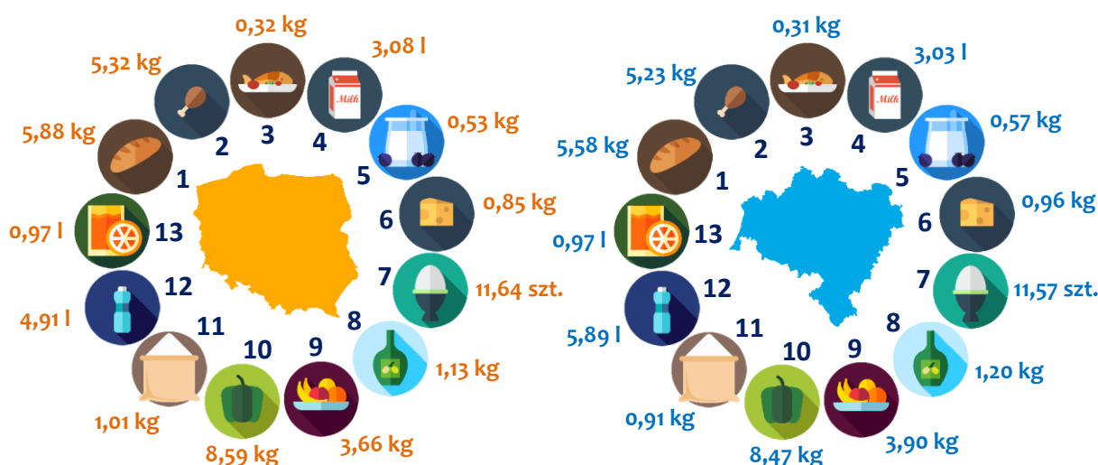
WYKRES 2. Przeciętne miesięczne spożycie niektórych artykułów żywnościowych na 1 osobę w gospodarstwach domowych w woj. dolnośląskim i w Polsce w 2016 r.

1 Pieczywo i produkty zbożowe 2 Mięso 3 Ryby i owoce morza 4 Mleko 5 Jogurty 6 Sery i twarogi 7 Jaja 8 Oleje i tłuszcze 9 Owoce 10 Warzywa 11 Cukier 12 Wody mineralne i źródlane 13 Soki owocowe i warzywne